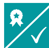
ARN / No repetición