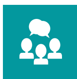
Comisión de la Verdad